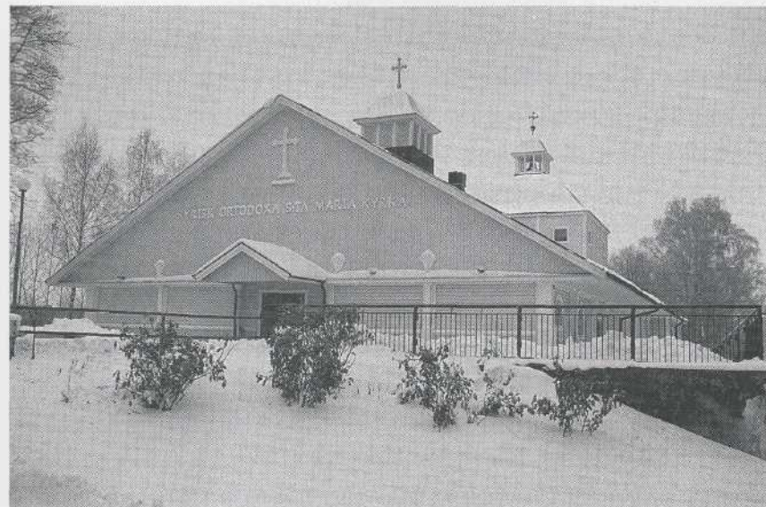
Syrisk ortodoxa S:ta Maria kyrka i Folkets Park i Norrköping

Sammanhållning och att stötta varandra i olika situationer är mycket viktigt. Föreningen ger ett bra nätverk och ett socialt skydd och har idag 560 betalande medlemmar, men föreningen är även öppen för familjer som av olika skäl inte har råd att betala medlemsavgiften något år. Styrelsen består av åtta personer som var och en ansvarar för olika sektioner. Det finns även en kvinnostyrelse som arrangerar större fester mm.