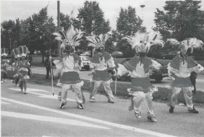
Centra Cultural Bolivia deltar i Hageby-festivalen i Norrköping i maj 1999.

Enligt Centro Cultural Bolivias stadgar är deras mål och inriktning att bilda och träna folkdansgrupper och musiklag med barn och ungdomar för solidariska arbeten och sprida bolivianska folkdanser till olika regioner och områden, på bolivianska fester, latinamerikanska organisationer, skolor, fackliga organisationer, kyrkor m fl., att anskaffa danskläder och bolivianska musikinstrument, anordna konferenser i utbildningssyfte, föreläsningar, anordna kamratskapsaktioner, traditionella bolivianska fester mm.