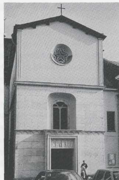
Katolska kyrkan, Sankta Birgitta Kyrka på Skolgatan i Norrköping