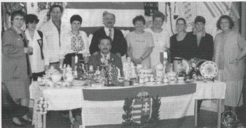
Szent István Ungerska föreningen deltar i "Gränslös gemenskap" i Hörsalen i Norrköping våren 1998.

Vad beträffar föreningens arkivhandlingar förvaras de hos ordföranden och samtliga handlingar finns från 1997-99 i form av protokoll, verksamhetsberättelser, kassaböcker, medlemsmatriklar, inkomna skrivelser, stadgar mm. Föreningen ger ut en medlemstidning Magyar Tükör (Ungersk spegel) med 2 nr/år och man har även fotografier, pressklipp och statistik.