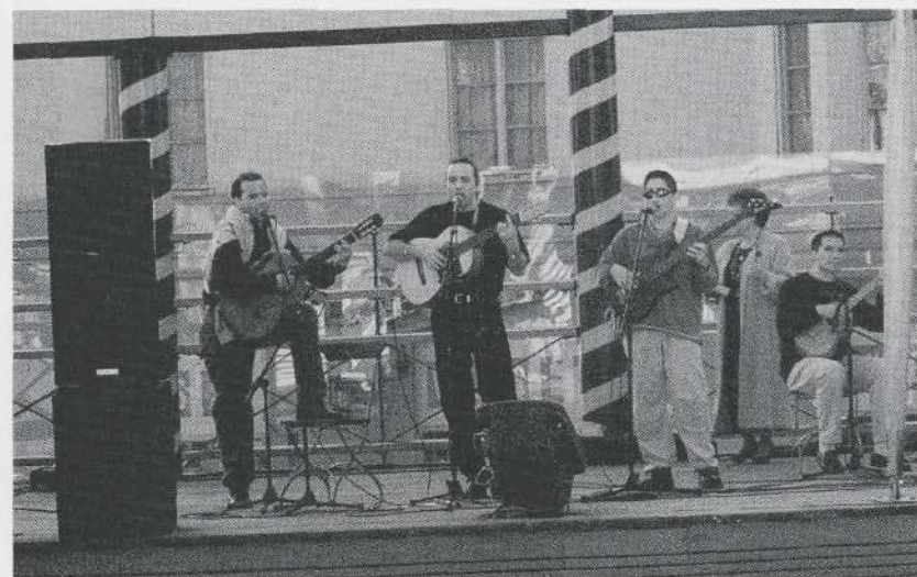
Musikgruppen Huayra Huasi uppträder vid Hörsalen i Norrköping våren 1999.