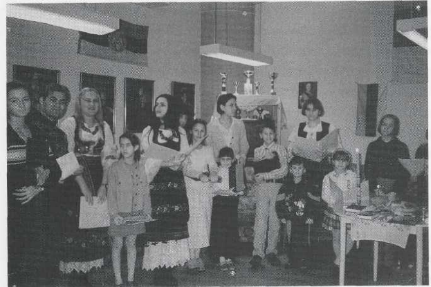
Ungdomar i Serbiska föreningen "Övre Serbica" läser dikter till Sankt Savas äminnelse. Sankt Savas är elevernas helgon.

Ett exempel är Serbiska föreningen "Övre Serbica" (tidigare Övre Serbica Hembygdsförening) i Norrköping. Enligt deras stadgar är föreningens ändamål att värna om och vårda det serbiska kulturarvet i den för sverigeserberna i Norrköping och Östergötland nya hembygds miljön och dess kulturarv och föra detta vidare till kommande generationer. Föreningen vill nå detta syfte bl a genom att befrämja kunskapen om och känslan för den nya hembygden och dess, ur historisk och kulturell synpunkt, värdefulla traditioner, dokumentera det serbiska inslaget i hembygds kulturen, aktivt medverka till serbernas kulturella integration i hembygden bl a genom samarbete med befintliga hembygdsföreningar i Östergötland, verka för en serbisk bygdegård i Östergötland, samarbeta med kommunala organ och kulturorganisationer samt stimulera till initiativ, som gagnar bygden och dess