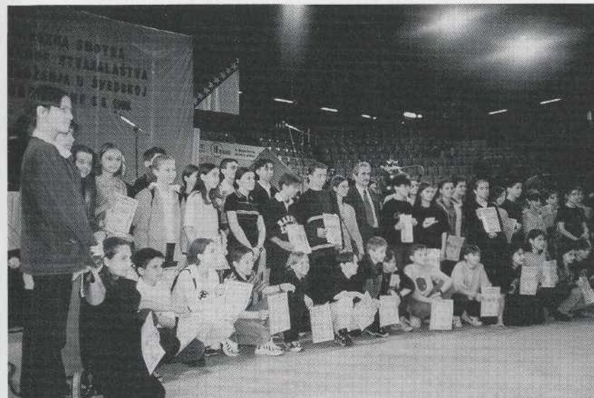
Kulturdag arrangerad av Föreningen Bosnien- Hercegovina. Skolungdomar mottager diplom för deltagande i kunskapstävlingar liknande "Vi i Femman".

verksamhetsområden. Sedan januari 1995 har föreningen drivit en bosnisk lördagsskola. Skolan har 18 lärare och ca. 220-230 elever. Man bedriver undervisning i det bosniska språket, historia, geografi, musik och religion. Ett syfte är att barnen ska kunna fortsätta i skolan i Bosnien i fall av återvandring. Bosniska lördagsskolan i Norrköping är den största bosniska skolan utomlands.