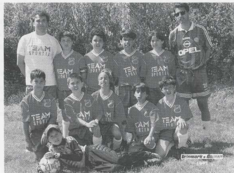
Salvatore Allende Kommitténs fotbollslag Chile Unido, pojklaget från 1997.

talets senare hälft. Trots att det framförallt rörde sig om politiskt engagerade och fackföreningsaktivister skedde också en renodlad kedjemigration från Tocopilla i norra Chile till Sverige. Andelen chilensare i Norrköping ökade med 4,4% under åren 1975-1990. Många av chilensarna i Norrköping kommer från staden Tocopilla som nämndes i ovanstående stycke. Den omfattande invandringen satte sina spår i Norrköpings föreningsliv. Från 1977 fram till slutet av 1980-talet bildades 20 latinamerikanska föreningar, varav de flesta var chilenska. Av dessa 20 föreningar är ungefär 12 verksamma än idag och det rör sig om idrottsorganisationer, kulturella organisationer och religiösa organisationer. En av de första som bildades var Salvador Allende kommittén (S.A.K). Enligt stadgarna från 1981 bildades kommittén officiellt 1977, men en grupp chilensare bosatta i Norrköping hade sedan 1975 verkat för solidaritet med det chilenska folket. I och med att ett ansevärt antal chilensare anlände till Sverige organiserades kommittén som ett gemensamt samlingsorgan för alla chilensare.