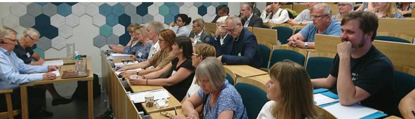
Bild nedan: I maj fattades det historiska beslutet att slå samman de båda föreningarna FA och NAF.