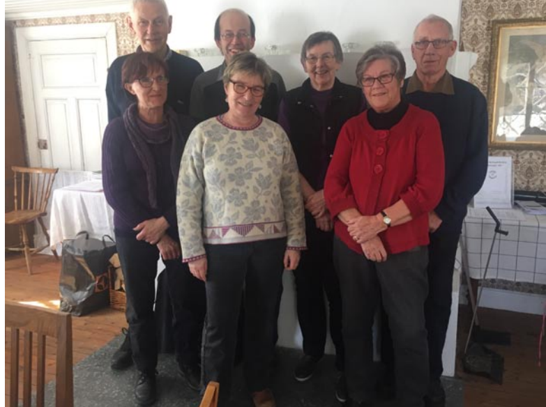
Intresserade deltagare vid arkivkurs för Tryserums hembygdsförening.

Vi har bistått med råd och handledning till de lokala arkiven och särskilda utbildningsinsatser har skett för Tryserums hembygdsförenings styrelse samt Vikbolandets arkiv- och historieförenings arbetsgrupp. Sammanlagt har länsarkivarien gjort 35 besök vid 17 medlemsarkiv.