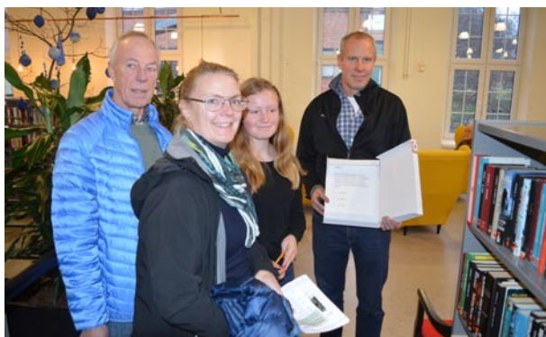
Skattjakten på Arkivens dag i Åtvidaberg lockade ett flertal deltagare. Det gick ut på att hitta frågor i arkivboxar som placerats ut i biblioteket.

För att tydligare kunna synas i publika sammanhang köptes under året in utställnings-skärmar, trottoarpratarna, folderhållare och en ny rollup trycktes. Vidare köptes en ny skylt till vår ytterdörr, där den gamla logotypen allt för länge hade hängt kvar. Den inköpta utrustningen kom väl till användning under Kulturnatten i Norrköping och på Arkivens dag.