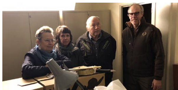
Besök hos Vreta Klosters hembygdsförenings representanter hösten 2018.

Östergötlands Arkivförbund är en bred och samordnande arkivorganisation med kunskap och kompetens om länets många lokalhistoriska initiativ och samlingar, en knutpunkt och registerinstans för de enskilda arkiven i länet.