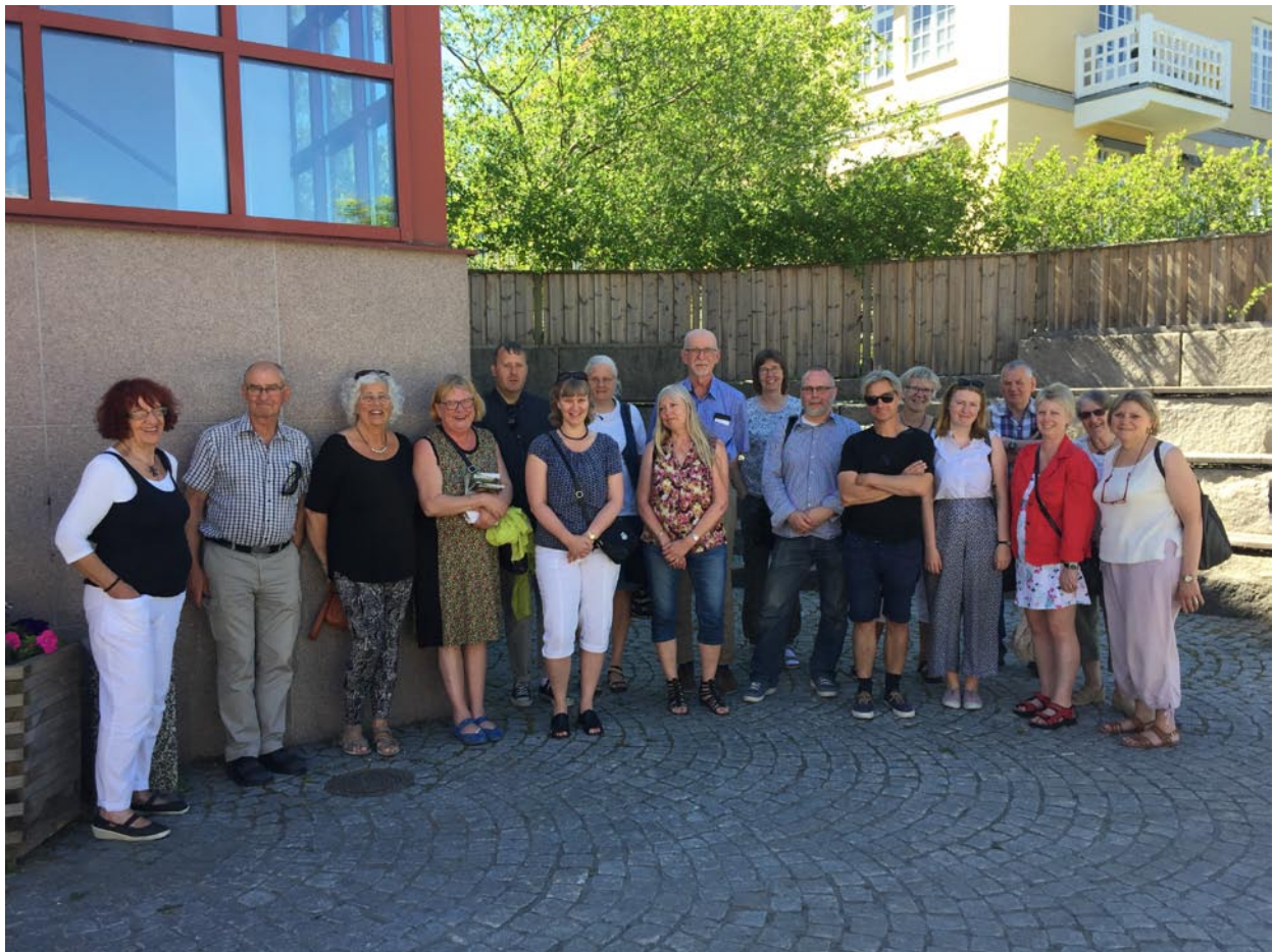
Arkivpersonal och styrelserepresentanter samlade vid vår konferens i Boxholm sommaren 2019.

Östergötlands Arkivförbund Vattengränden 14 602 22 Norrköping