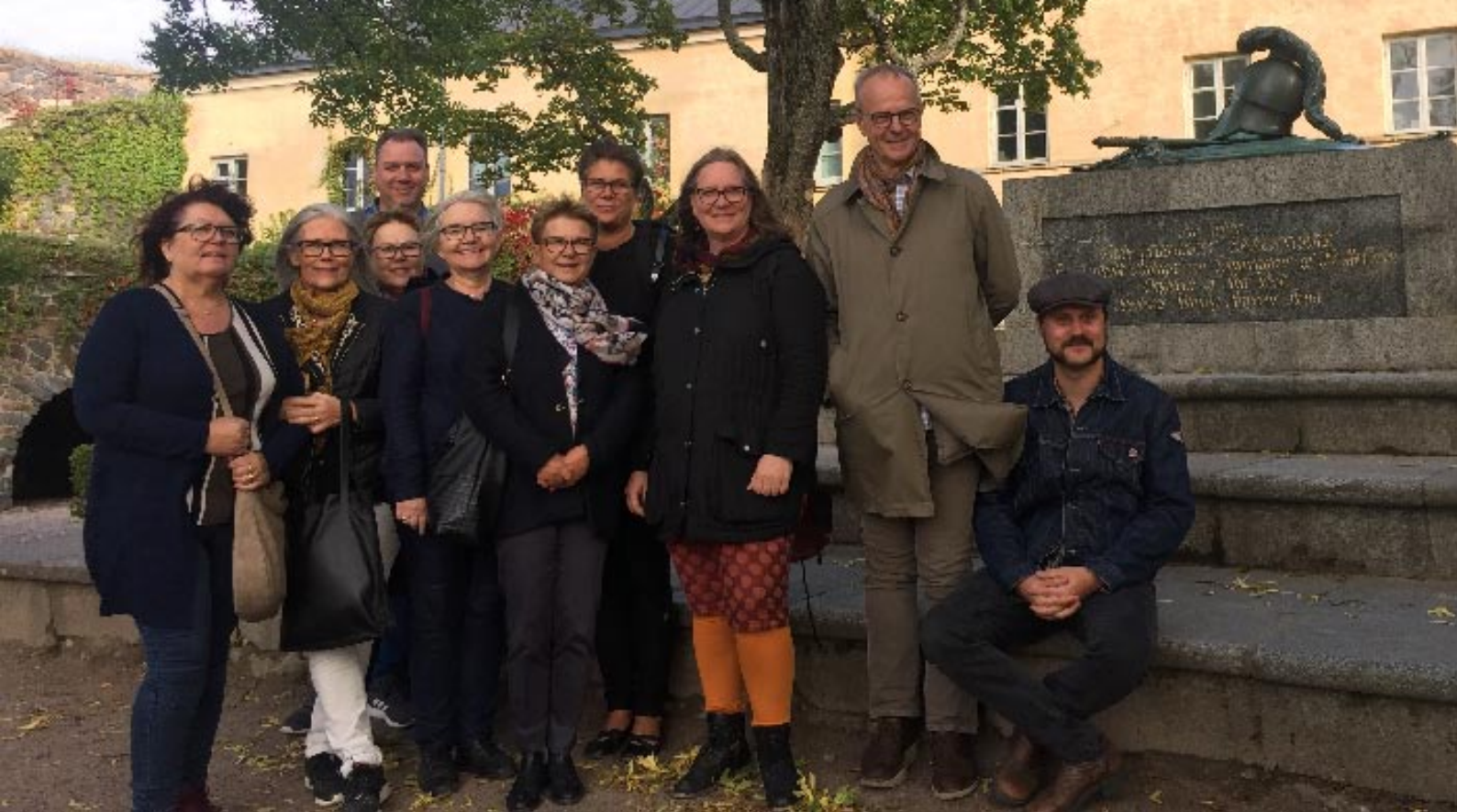
Länsarkivariieföreningen vid Sveaborg, Helsingfors vid studieresan 2018.

delar ut Finlands största litteraturpris. Arkivet omfattas bl.a. av brevsamlingar och manuskript och de arbetar mycket med digitaliseringens möjligheter.