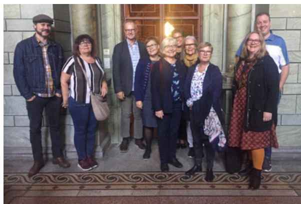
Länsarkivarietföreningen samlade vid Finska Riksarkivet i Helsingfors.

Under året har länsarkivarien varit delaktig i Arkivnätverk Östergötland, Östgötaaljud, Fotonätverk Östergötland och ingått i styrelsen för Centrum för Lokalhistoria, och styrgruppen/referensgruppen för Kulturarv Östergötland samt varit regionansvarig för Arkivens dag. Länsarkivarien har även varit sekreterare i Näringslivens förening (NAF), valberedare i Folkörelsernas Arkivförbund (FA) och valberedare i Föreningen Sveriges länsarkivarier.