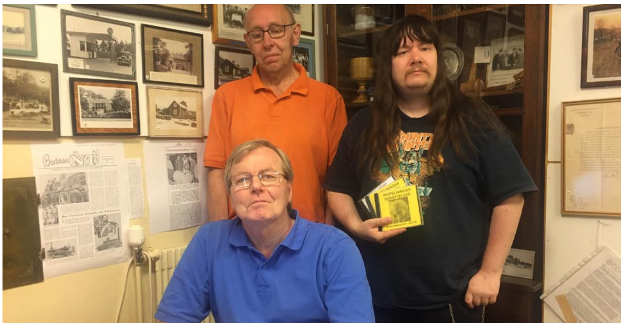
Personal vid Kville försningsarkiv som bl.a. arbetat med inskanning av fotografier.