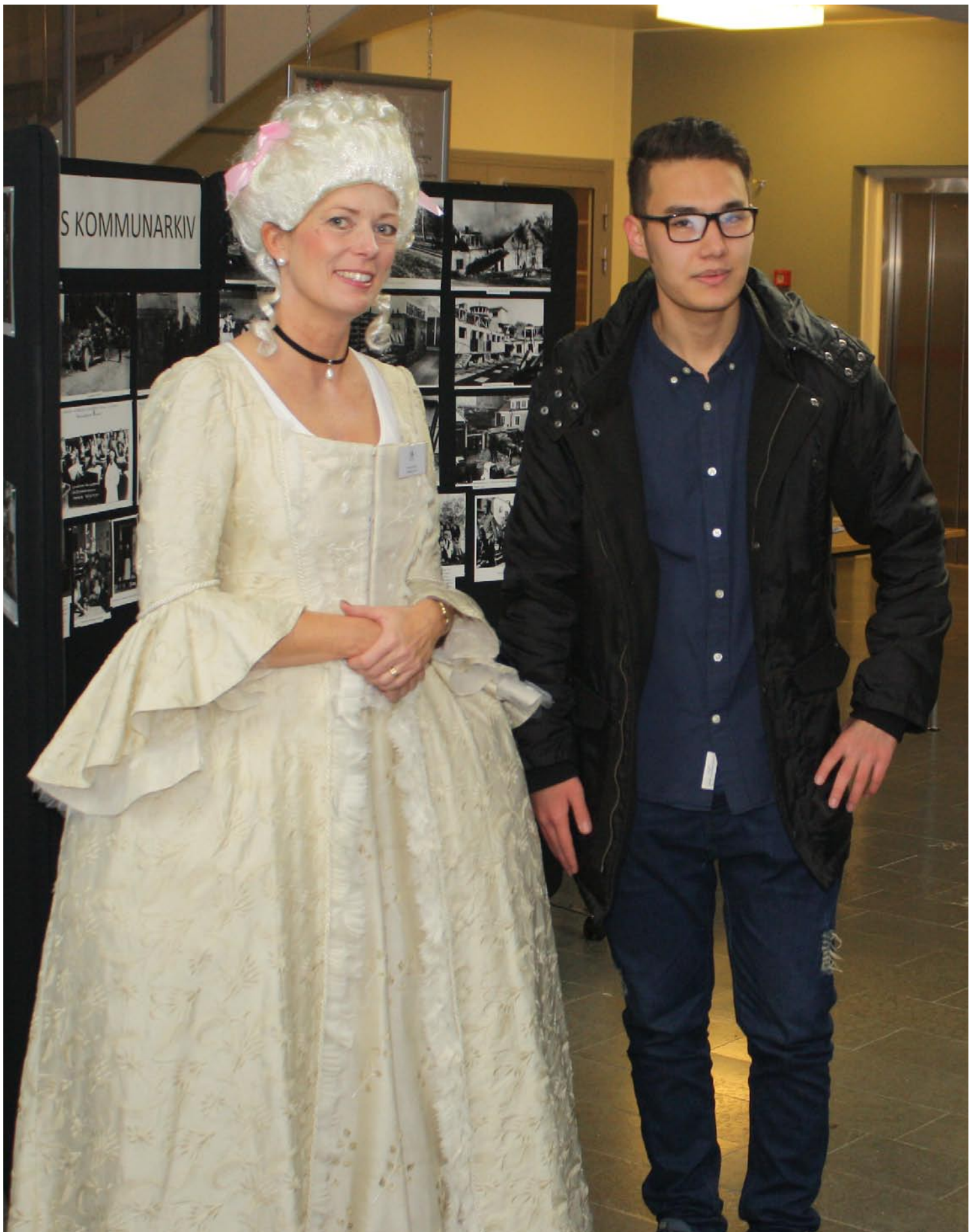
Östergötlands Arkivförbund Verksamhetsberättelse 2015