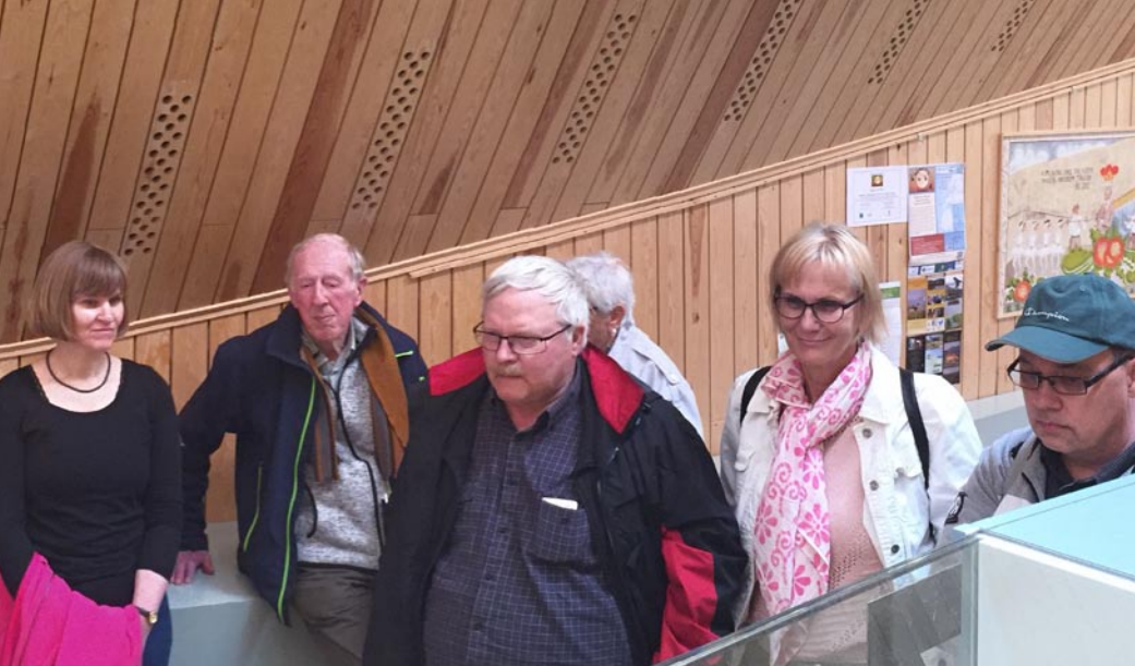
Från sommarens personalträff vid Naturum Tåkern som lockade ett flertal personer från de lokala arkiven.

sammanträtt vid två tillfällen. NAF, FA och länsarkivariieföreningen fyller alla viktiga funktioner för att föra fram frågor som berör vår verksamhet.