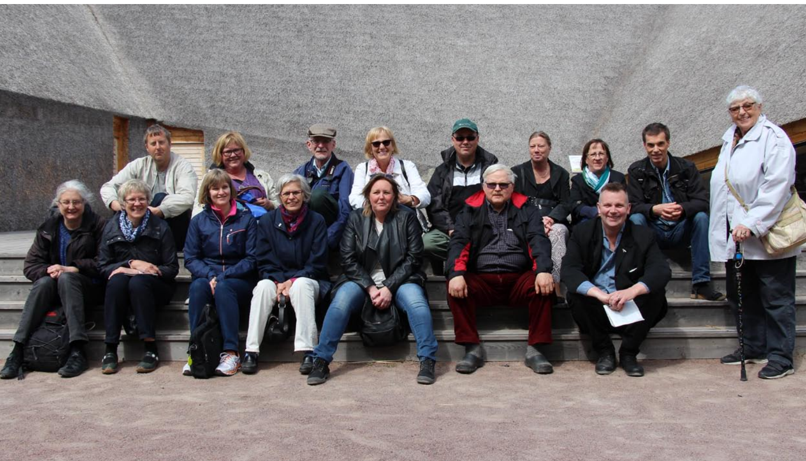
Representanter från de lokala arkiven samlade på personalträff vid Naturum Tåkern 2015.

Vi har fortsatt med vårt långsiktiga arbete att registrera historiska försäkringsbrev, skanning av de lokala arkivens bilder, digitalisera arkivförteckningar i redovisningssystemet Visual Arkiv, ordnings- och förteckningsarbete, kursverksamhet, m.m. Vidare har vi fortsatt att utveckla nätverk och publik verksamhet, inte minst när det gäller Arkivens dag.